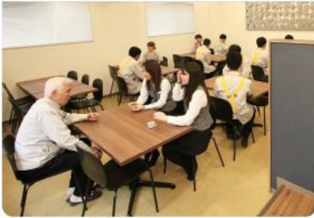
①①新しくなった食堂