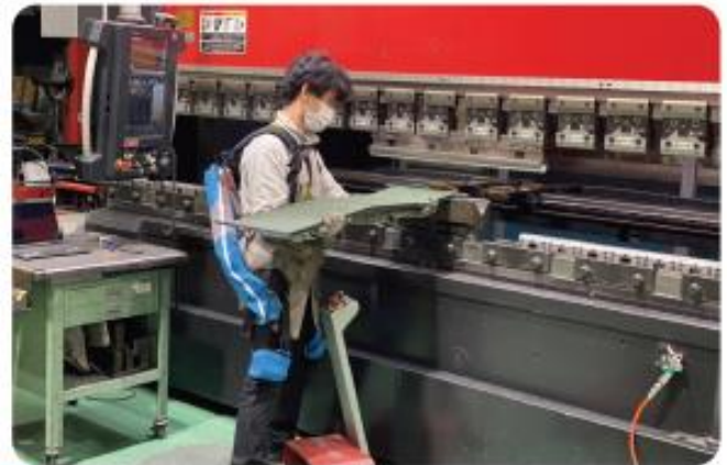
①④パワーアシストスーツを着て作業をするようす