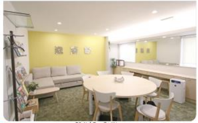
①②新しくなった女子更衣室 女性の働きやすさを考えてつくられています。